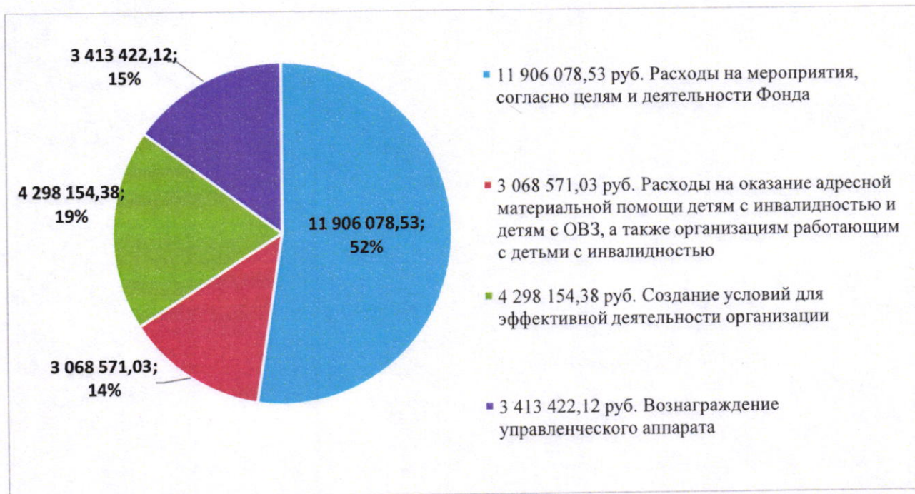
Диаграмма 2. Расходование денежных средств, руб.