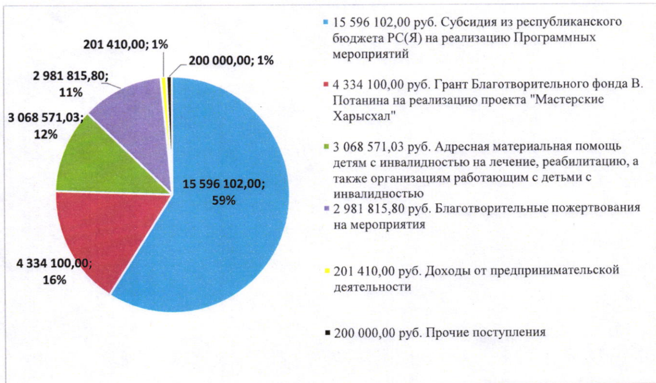
Диаграмма 1. Поступление денежных средств, руб.

Всего в отчетном году расходы на реализацию программных мероприятий и оказание адресной благотворительной помощи составили 22 686 226,06 рублей. (Приложение 1)